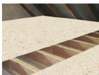
esb (elka strong board) als Deckenplatte im Dachstuhl.