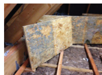
Keine Lösung im Dachspeicherboden sind diffusionsdichte Plattenwerkstoffe mit der Folge von Schimmel.

esb Platten (P5) gefertigt nach DIN EN 312, Qualität garantiert, zertifiziert und überwacht. Innovationen inklusive.