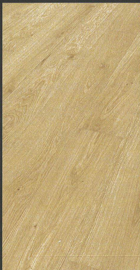
Eiche lebhaft pure 8936 / gebürstet