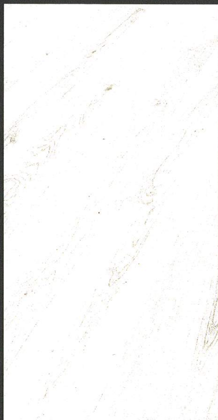
Eiche lebhaft cremeweiß 8937 / gebürstet